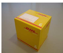
6 - Box 15 Kg 41,7x35,9x36,9