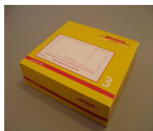
3 - Box 2.0 Kg 33,7x32,2x10,0