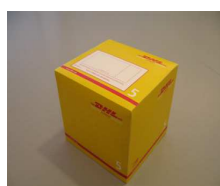
5 - Box 10 Kg 33,7x32,2x34,5