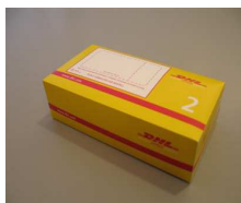
2 - Box 1.0 Kg 33,7x18,2x10,0