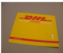
1 - Busta 0.5 Kg 35,0x27,5x1,0