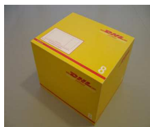
8 - Box 25 Kg 54,1x44,4x40,9