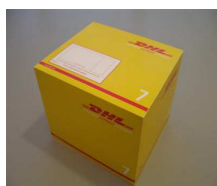
7 - Box 20 Kg 48,1x40,4x38,9