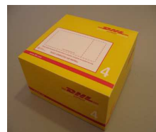
4 - Box 5 Kg 33,7x32,2x18,0